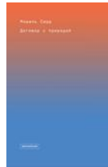
Договор с природой М. Серр 2022 печатная книга

что в вопросах финансов и заключения сделок хорошо разбирались как купеческие дочери, так и представительницы всех экономически активных сословий. Социальный статус предпринимательниц варьировался от мещанок и солдаток, управлявших небольшими ремесленными предприятиями и розничными магазинами, до магнаток и именитых купчих, как владелица сталепрокатных заводов дворянка Надежда Стенбок-Фермор и хозяйка крупнейших в России текстильных фабрик Мария Морозова.